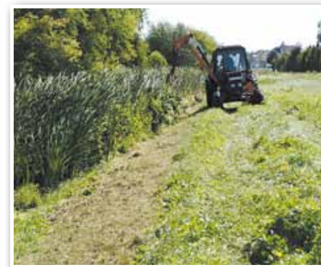
Bernátkúti árok, Nagyvenyim 2019.08.21.