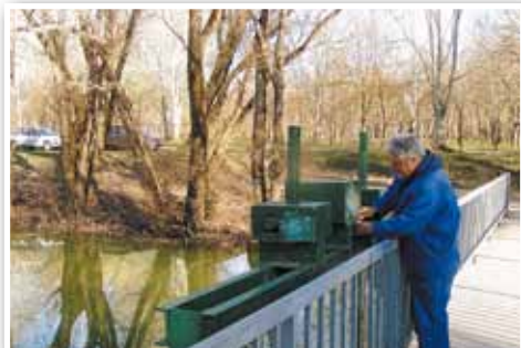
Dunaújváros Szabadstrand 2019.03.21.

Ha önnek is van olyan vízelvezető árka, aminek a fenntartása nem biztosított, kérjen ajánlatot a vizitársulattól!