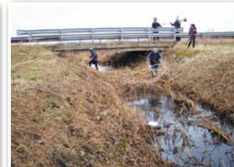
Sárosd-Seregélyesi víz má Darumajor 2019.02.22.