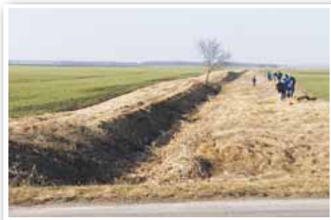
Hantosi S1 árok 2019.01.31.