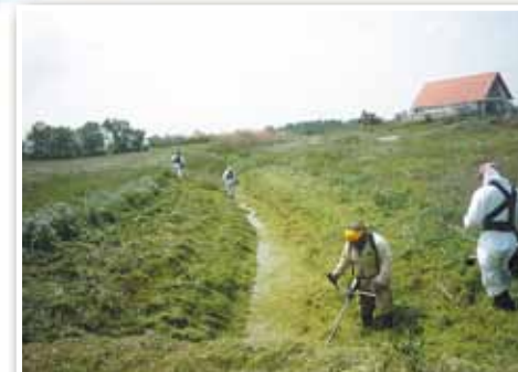
Kossuth-telepi árok 2019.05.13.