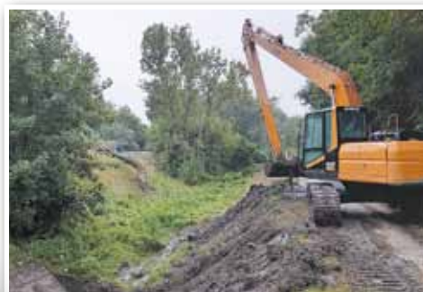
Felsőfoki patak 2019.08.14.