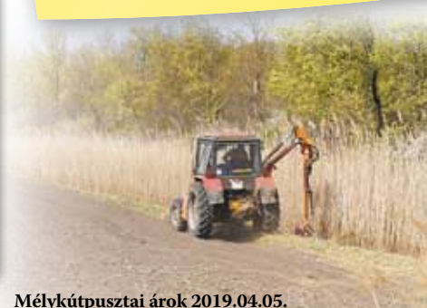
Mélykútpusztai árok 2019.04.05.