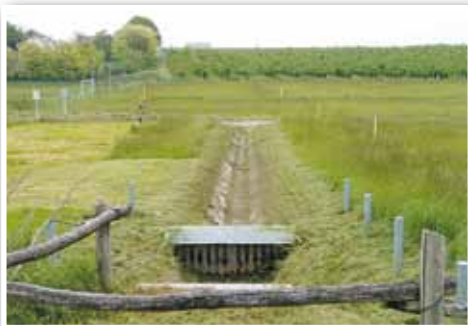
Bernátkúti árok 2019.05.29.