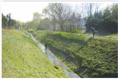
Lak patak 2019.04.15.

Amennyiben úgy gondolja, hogy szükséges a vizitársulat fennmaradása, kérjük támogassa az általunk végzett munkát.