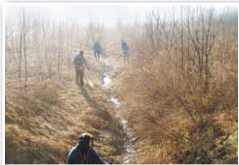
Alsófoki patak 2019.02.18.

A tagi hozzájárulás ajánlott összegét – a szükséges feladatok ismeretében – a küldöttgyűlés határozza meg, de a befizetni kívánt összegről ön dönt. A befizetés önkéntes.