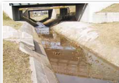
Nagyvenyim-Baracsi ér 2019.03.27.