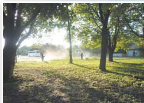
Besnyő zöldterületek 2019.08.13.