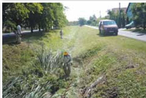
Szekszárd Szőlőhegy 2019.08.01.