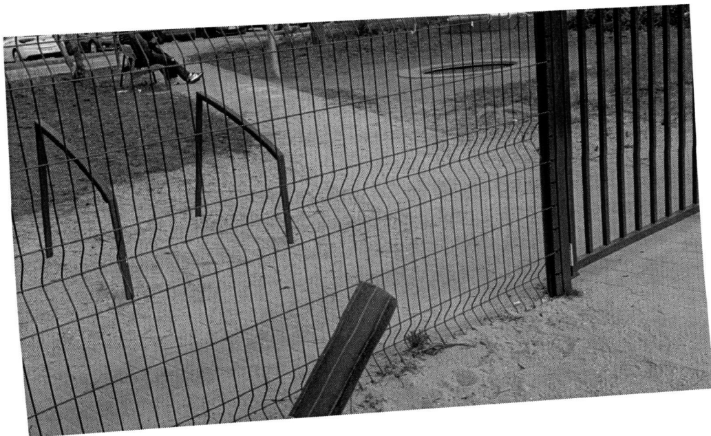
Játszóteri játék darab

Bejelentés érkezett a Jarokelo.hu közterületi hibabejelentő oldalon keresztül, amely feltehetően az Ön szervezetének hatáskörébe tartozik.